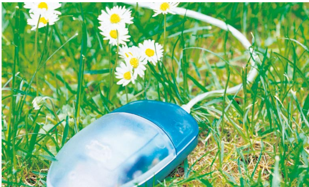
Auktionshuset Get Through Power vil gøre prisen for at skifte til grøn energi tydelig for virksomheder.